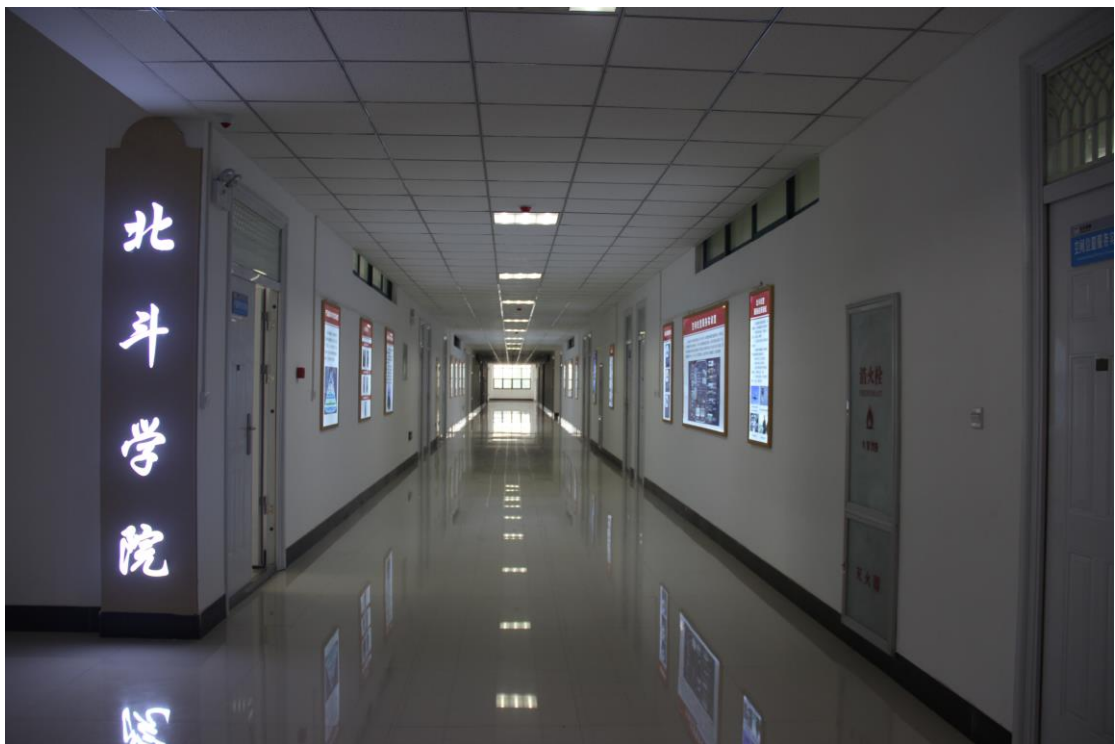
测绘与规划学院北斗学院