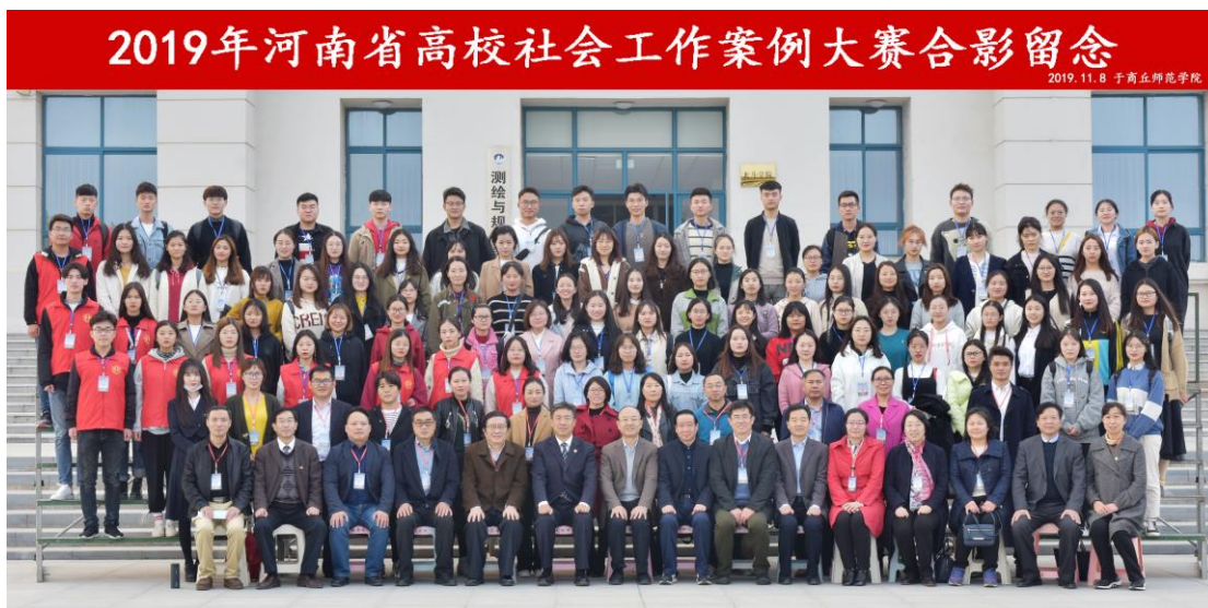
河南省社会工作案例大赛