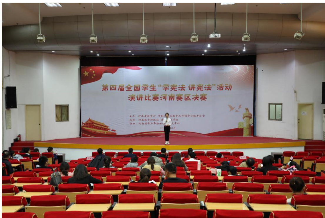
河南省“学宪法 讲宪法”演讲比赛一等奖